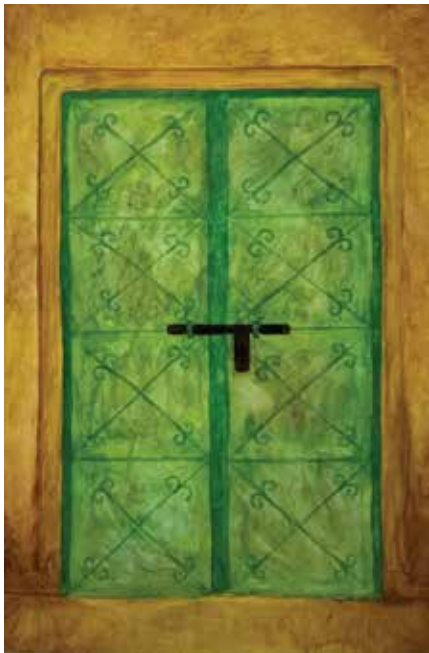
By: Haneen Al Hamdani