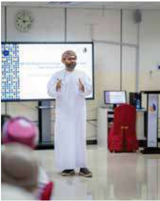
الاجتماع الأول لمجموعات عمل التقييم الذاتي ل ISA