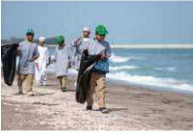
"حملة تنظيف الشاطئ"