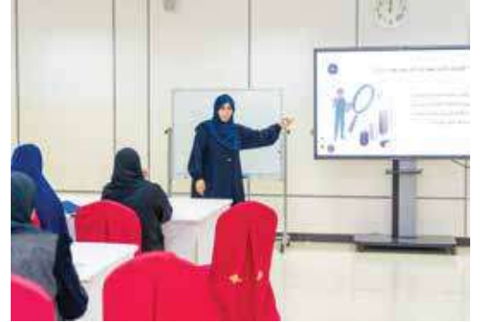
ورشة عمل " إدارة التغيير المؤسسي من مقاومة التغيير إلى ثقافة التجديد المؤسسي"