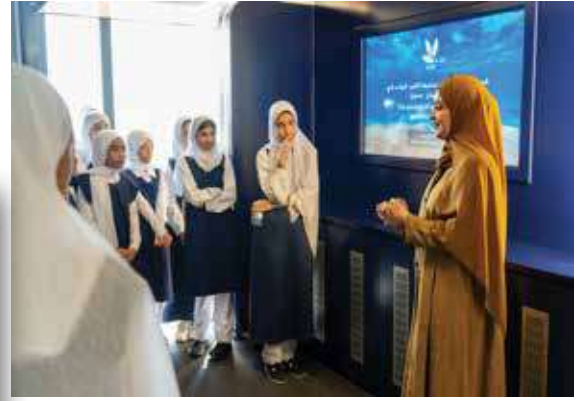
معرض "الوحدة التوعوية المتنقلة"