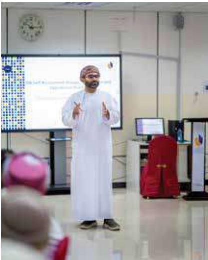
First Meeting of the ISA Self-Assessment Working Groups