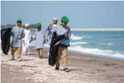
Beach Clean-up Campaign