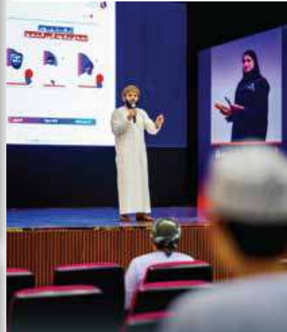
A Lecture Titled "A Challenge that Leads to Excellence"