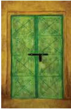
بريشة الطالبة: حنين الحمدانية اسم اللوحة: عتبة الذكرة