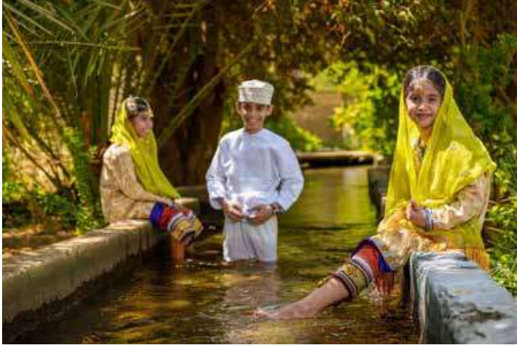
By: Ru'ya Ali Al Nasri