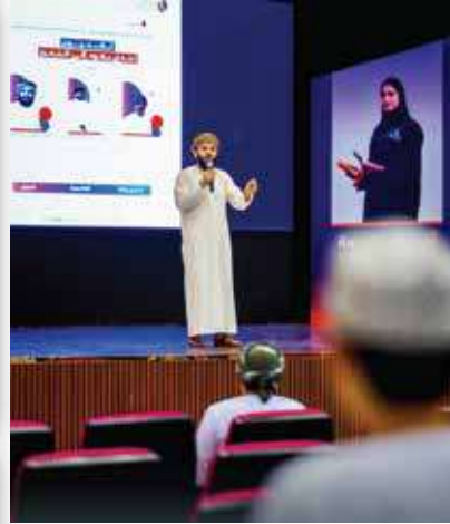
محاضرة تحفيزية بعنوان « تقنيون... تحدّ يقود إلى التميز »