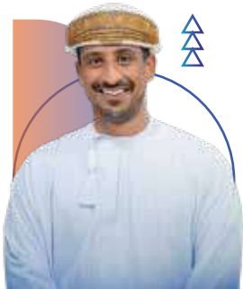
Dr. Hamad bin Juma Al Nuaimi

The achievements realized are the result of collective institutional efforts and a firm belief that investing in people is the foundation of progress and leadership.