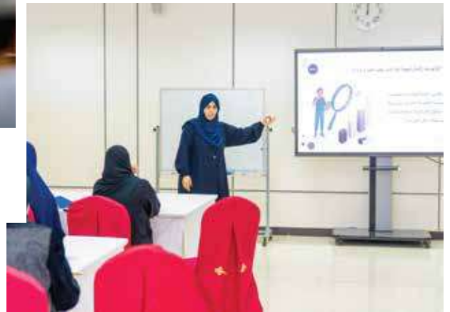
A Workshop Titled "Institutional Change Management: From Resistance to a Culture of Renewal"